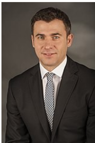
Wojciech Olejniczak SLD – ojciec chrzestny afery.

Afera ma początek w 2004 r. kiedy ówczesny minister rolnictwa Wojciech Olejniczak z SLD z rządu Marka Belki SLD wbrew ustawie, wydał rozporządzenie zezwalające na ubój zgodny z obyczajami zarejestrowanych w Polsce kościołów i związków wyznaniowych (chodzi o muzułmanów i wyznawców judaizmu) ale tak naprawdę chodziło o opłaty pobierane od tego uboju czyli żydowska opłata kosher i islamska opłata halall.