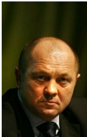
Marek Sawicki – Minister PSL

III etap to – cd „szybkiej ścieżki” prowadzonej już przez nowego ministra rolnictwa Marka Sawickiego z PSL, fanatyka uboju rytualnego!!! https://www.wprost.pl/407847/sawicki-moralnosc-wobec-zwierzat-czy-praca-decydujemy.html