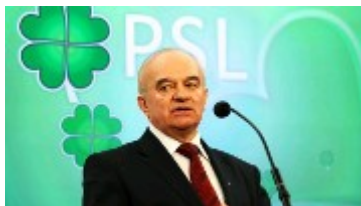
Stanisław Kalemba - Minister PSL

II etap afey to - tzw. „szybka ścieżka” którą wprowadził na życzenie lobby ubojowego, minister rolnictwa -Kalemba (PSL) chcąc w ten sposób ominąć prawo oraz wymagane szerokie konsultacje społeczne, zastępując je doraźną konsultacją z zaprzyjaźnionymi firmami i stowarzyszeniami, które są powiązane interesami z PSL i które kierując się tylko własnym zyskiem chciały zalegalizować ten okrutny proceder w Polsce. Lobby ubojowe które zleciło „szybką ścieżkę” kupiło sobie przychylność urzędników państwowych , którzy dokonali zmian w Ustawie o Ochronie Zwierząt zgodnie z ich zaleceniami, co ma charakter korupcyjny oraz przy okazji naruszyło ustawę lobbingową. https://www.forbes.pl/wiadomosci/kalemba-przywrocic-uboj-rytualny/4rwlzzm