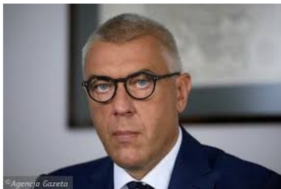
Mec. Roman Giertych

Roman Giertych w ten sposób zwalcza chrześcijaństwo w Polsce a popiera islamizację Polski!!!