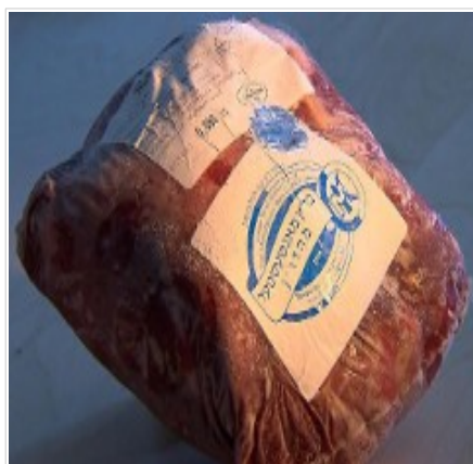
Koszerne mięso z Polski dostępne w Izraelu.

Od początku stycznia 2013 roku w Polsce nie wolno było praktykować tzw. uboju rytualnego, który polega na podrzynaniu gardła zwierzęcia na żywca bez uprzedniego ogłuszenia zwierzęcia. Tymczasem w Izraelu wciąż można kupować koszerne mięso z Polski. Reporterzy programu „Po prostu” (TVP1) nie mieli problemów ze znalezieniem w Jerozolimie polskiego mięsa, które "wyprodukowano" w listopadzie 2013 roku. – Nie ma żadnych problemów z dostawą. A klienci lubią polskie mięso – powiedział sprzedawca.