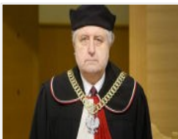
prof. Rzepliński prezes TK (zwolennik komercyjnego uboju rytualnego)

Gdy Trybunał Konstytucyjny ogłaszał wyrok ws. uboju rytualnego. Tyle wielkich słów o wolności religijnej i prawach człowieka, by usprawiedliwić proceder, którego tak naprawdę usprawiedliwić się nie da bo chodzi o pieniądze i tylko pieniądze (ok 2 miliardów złotych).