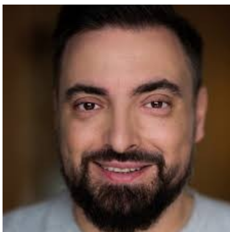
Redaktor Sekielski – to on ujawnił Aferę Uboju Rytualnego

Program Sekielskiego ujawnił w jaki sposób PSL łamało prawo wspólnie z ortodoksyjnymi Żydami i islamistami dla których polskie prawo nie ma najmniejszego znaczenia. Minister Kalemba został zapoznany z materiałem o przestępstwach dokonanych przez takie ubojnie i ich klientów i powinien natychmiast zgłosić ten fakt Prokuraturze !!! Jeżeli nie zgłosił takiego przestępstwa to on również podlega odpowiedzialności karnej zgodnie z kodeksem karnym!